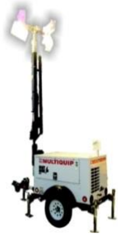
TORRE DE ILUMINACIÓN DIESEL O GASOLINA